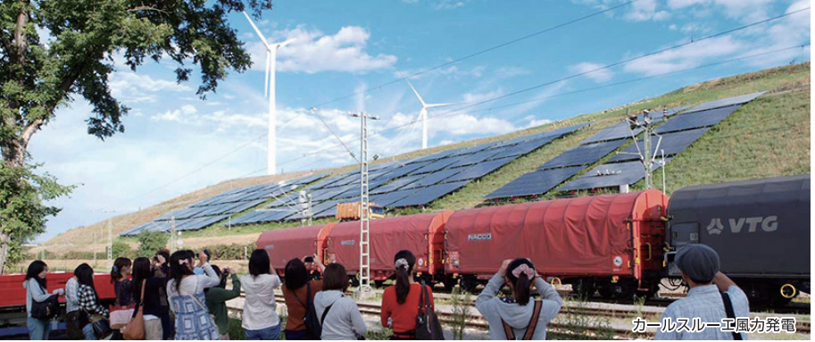
カールスルーエ風力発電

ドイツの「環境首都」として名高いフライブルクを中心に持続可能な地域社会について、エネルギー、交通政策、まちづくりといった視点から学びます。様々な視察先をドイツ在住の環境ジャーナリストの解説を受けながら共通の問題意識を持つ参加者(大学生)と巡ることで、単なる視察に終わらず日本を振り返り、視野を広げ、お互いの考えを深めることができるでしょう。