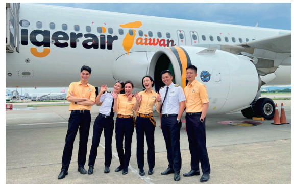
タイガーエア台湾 日本総代理店