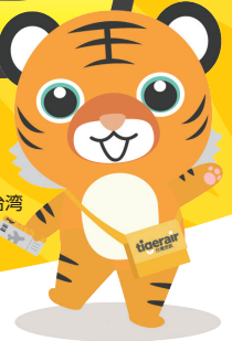
タイガーエア台湾 キャラクター 「フーちゃん」