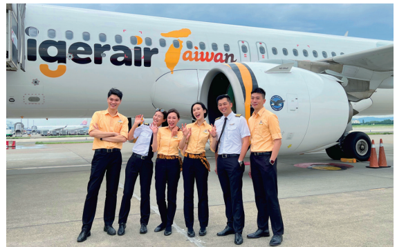
タイガーエア台湾 日本総代理店