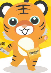
タイガーエア台湾 キャラクター 「フーちゃん」