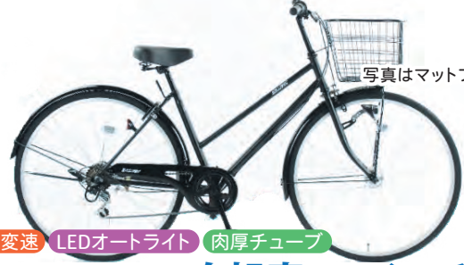
写真はマットブラック